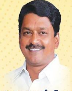
శ్రీ పయ్యాపుల కేశవ్ గారు ఆర్థిక, ప్రణాళిక, వాణిజ్య పన్నులు మరియు శాసనసభా వ్యవహారాల శాఖ మంత్రి వర్కులు ఆంధ్రప్రదేశ్ ప్రభుత్వం