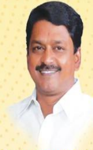
Sri Payyavula Keshav Minister for Finance, Planning, Commercial Taxes and Legislative Affairs Government of Andhra Pradesh